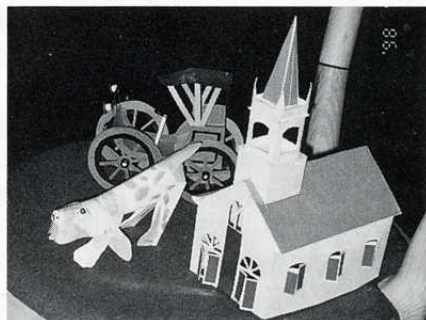
楽しい紙工作の作品例

クラブ活動の時間は決して強制しない自由参加を大原則としている。現在のところ93歳を最年長に10名前後の参加者がいる。指先を動かしてモノを作ることは、機能・技術・熟練そして創造性を伴い脳細胞の活性化にととても良い。具体的には、段ボールや空箱など身近な材料を使い、色紙（感性）と形（知性）の組合せを遊び心で、楽しんでもらえるよう毎回工夫して、孤独になりがちなお年寄りの動かない手指を支えながら作品作りに励んでいる。お年寄りに生き生き人生を味わってもらうため、知恵や経験が生かせる今が充実していると思う。