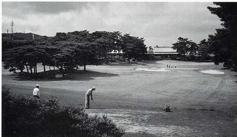
▲ コースからの風物詩 “風車” 左側前方風神山に見える