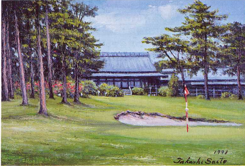
大みかゴルフ場風景 副会長 斎藤 隆画